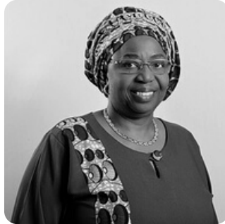
Pr. Awa Marie COLL-SECK

Ministre d'État auprès du président de la République du Sénégal