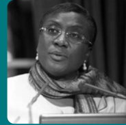
Pr. Dorothee KINDE-GAZARD Ancienne Ministre de la santé Bénin