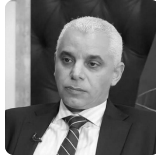
Pr. Khalid AIT TALEB

Ministre d'État auprès du président de la République du Sénégal